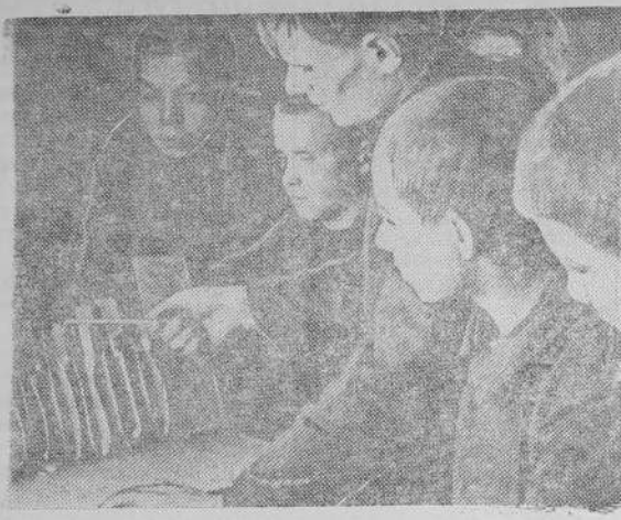
На снимке: Занятие кружка ПВХО в школе ФЗО № 2 Южно-Карабашского рудоуправления.

Стало быть в обязанность консультанта входит — заранее познакомиться с методами работы стахановца, и на основе этого, вместе со стахановцем составить программу, помочь стахановцу составить план — конспект занятий, подготовиться к выступлению на занятии,